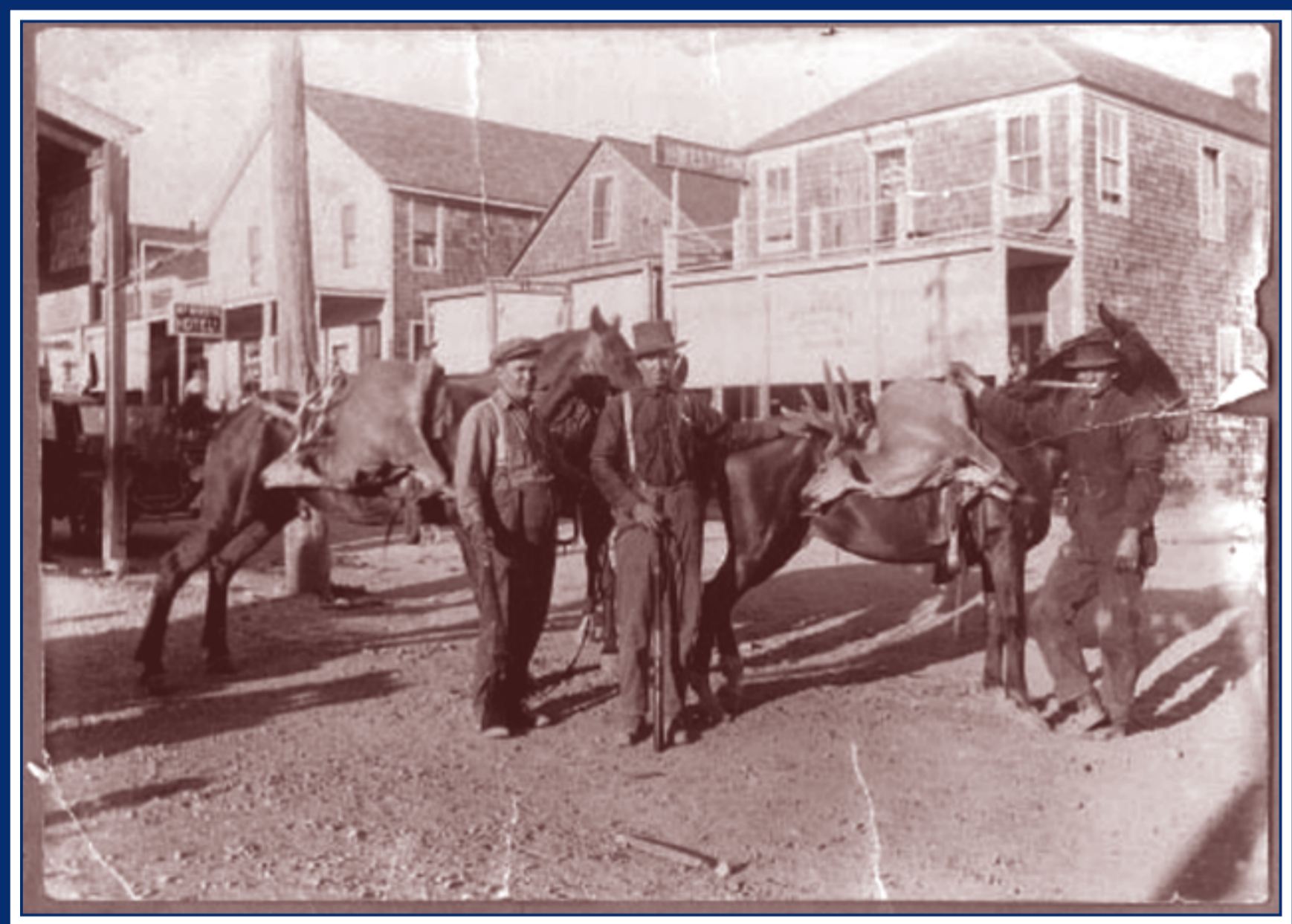
Weed, California, 1915 circa. Cacciatori con le prede di fronte al Western Hotel.