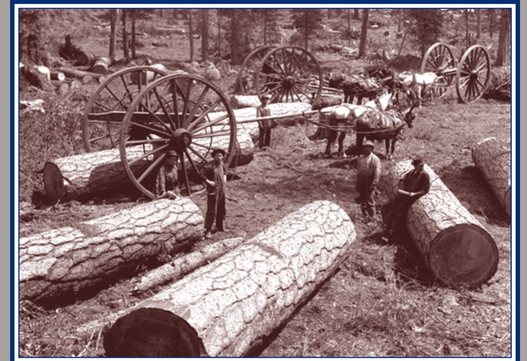
Mc Cloud, River Lumber Co. Grosse ruote per il trasporto del legname.